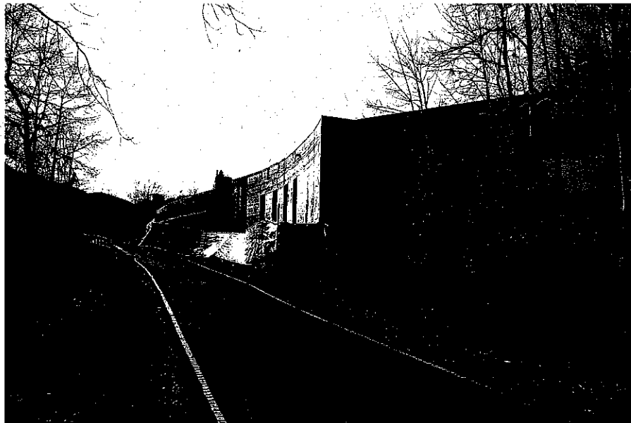
Nuovo edificio e moncone emergente della manica NE di Casc. Benedicta (in direzione di Capanne di Marcarolo)

Per quanto concerne il completamento dell'involucro edilizio esistente, realizzato con un precedente lotto di lavori già oggetto di confronto con le NTA di Piano e di relativo parere,