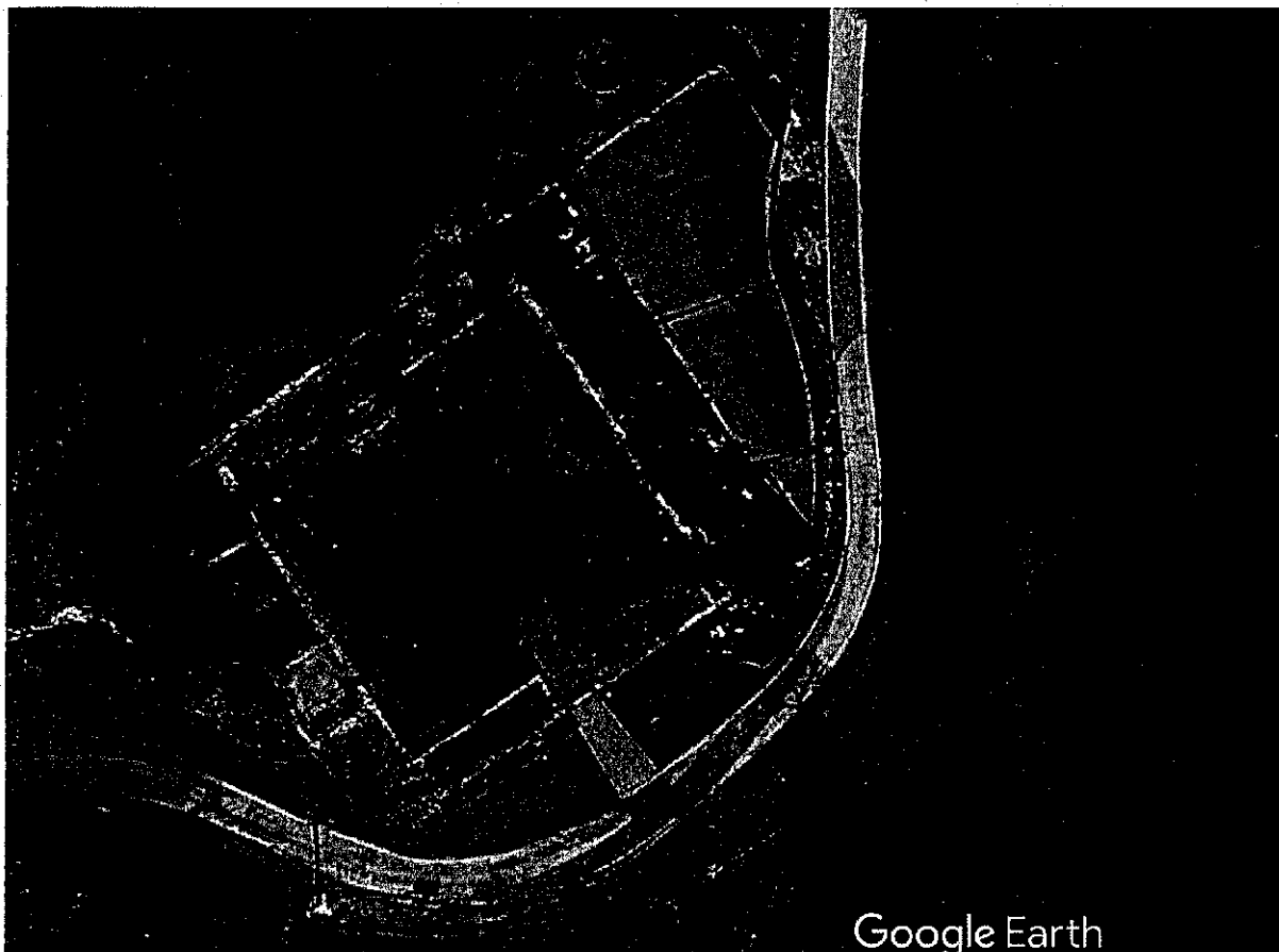
Immagine satellitare, in evidenza l'immobile oggetto di intervento.