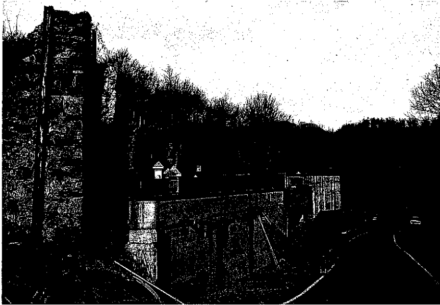
Manica NE di Casc. Benedicta e nuovo edificio (in direzione di Bosio)

l'areale rimanente, che si estende fino a ricomprendere Casc. Pizzo, è interessato essenzialmente dal passaggio interrato di condotte idriche e cavidotto in corrispondenza della viabilità principale (S.P.165) e secondaria di accesso alla cascina stessa.