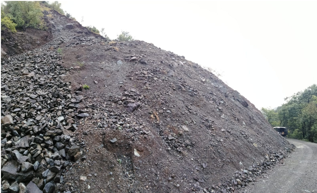
Fig. 2 – Vista di insieme della frana (settembre 2025)

La strada oggetto di intervento è di natura comunale e il tratto interessato fa parte delle strade di penetrazione all'interno del Parco Naturale delle Capanne di Marcarolo.