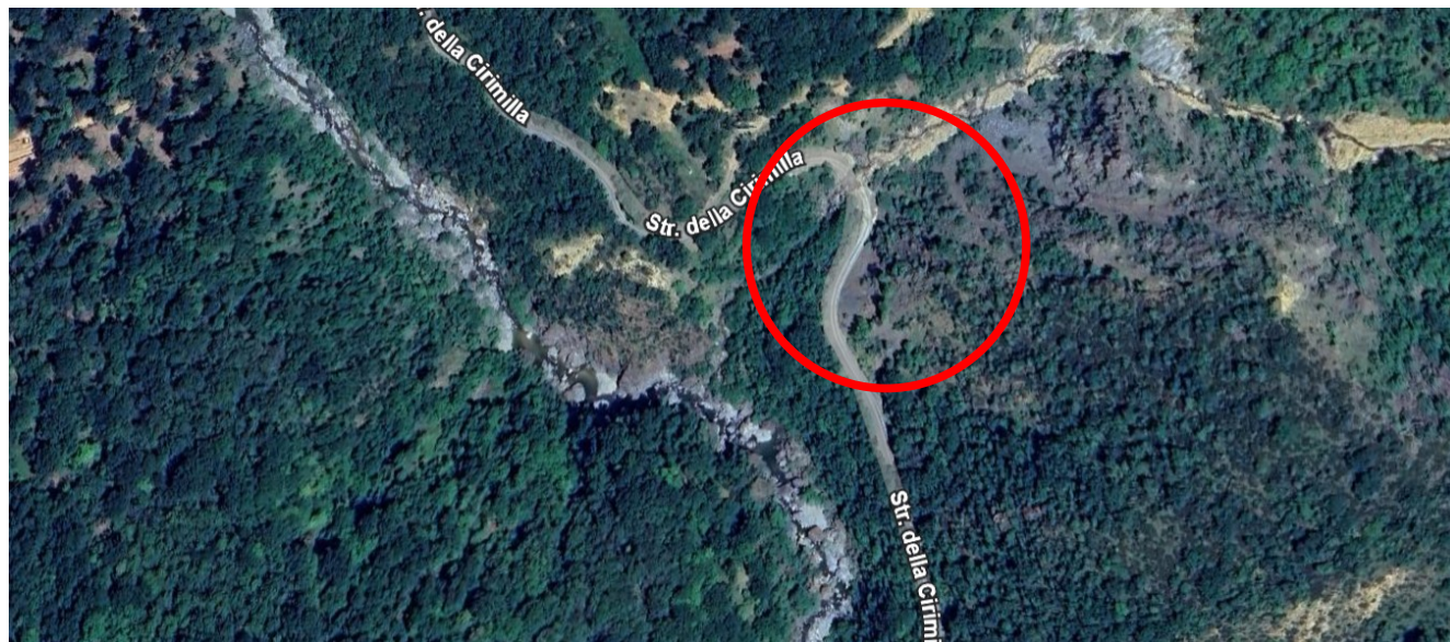
Fig. 1 – Localizzazione dell'area di intervento (estratto da ortofoto Google Earth)

La strada è periodicamente oggetto di frane dovute principalmente alla natura friabile della parete rocciosa, formata da rocce instabili e con scarsa presenza di vegetazione.