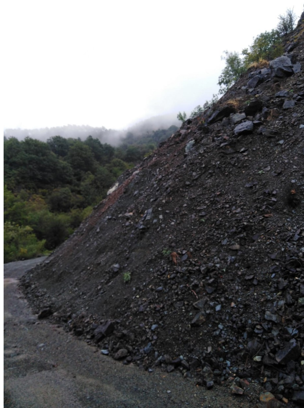
Fig. 3-4– Alcune immagini di dettaglio della consistenza del versante (settembre 2025)

Attualmente la strada in oggetto è l'unico tratto di collegamento tra la SP165 e tali abitazioni, non esistendo altri tracciati in grado di raggiungere il luogo.